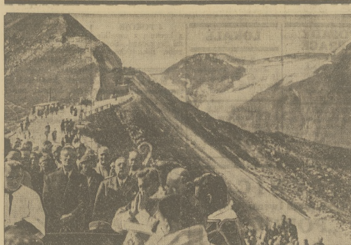
AUTOSTRADA NA GROSS - GLOCKNER.

W tych dniach odbyła się w Austrii poświęconie nowo powstałej autostrady na Gross-Glockner. Droga prowadzi na wysokość 3711 mt. Na uroczystości był obecny prezydent Austrii Miklas oraz kanclerz dr. Schuschnigg.