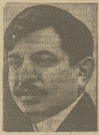
PROTR LAVAL nowy minister spraw zagranicznych Francji

BERLIN, 15.10. Zakupcy uszka Polacki statek pokoju „Elenka”, który dowoził się w drodze z Kłorbji do Gdyni, stracił w czasie burzy kół przyładka Arcona maszyni przelocji. Mieszcy omówili po-husztawienia, a próby aresztowania kłoczych zawichy. Na pomoc przyjechał z Saasmita statek „Seemooze” i z Hamburga parowiek „Koerle”, które przyholowały „Elenka” do portu w Saasmit.