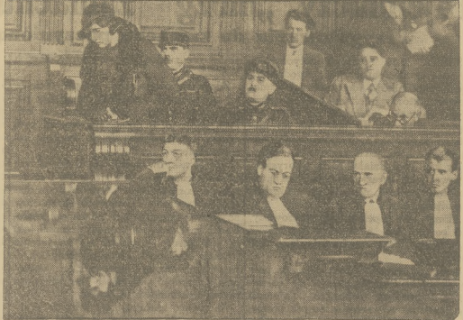
VIOLETTA NOZIERES NA ŁAWIE OSKARŻONYCH.

Wyrok został zastosowany niekaskazem, aby skazać — w myśl tradycyjnemu aważują przy ożewkach, dokonuanych na kobielach — prowadzona była na ożewku w białej koszuli z białym zakrytą wołem i z obażeniami stopami.