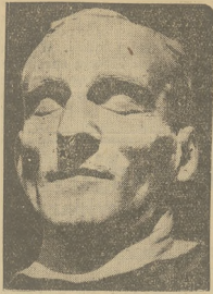
MASKI POMIERZENI: OFIAR TRAGEDJI MARŠYJSKIEJ. Ś. p. król Aleksander, Ś. p. m. Barbuou.