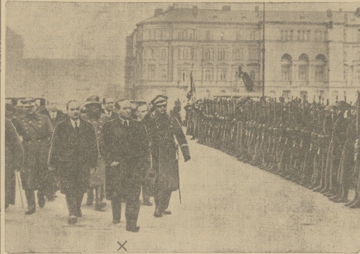
PREMIER GOEMBOES W WARSZAWIE przeobrazi przed frontem honorowej kompanii po złożeniu wieńca na grobie Nieznanego Żołnierza.

„Dziś chodzi o to, byśmy wszyscy się spojili w atmosferze pełnej dołnawej w pracy, na nieprawidłowym błędów naszego systemu ubezpieczeniowego i abyśmy szli do tej pracy bez jakiegokolwiek uprzedzeń i apriorystycznych założeń. Trezba się zdobyć na spokojność na sprawie nietyko z punktu widzenia światopoglądu „emerytalnego”, ubezpieczeniowego, czy tylko zawodowo — ubezpieczeniowego, lecz z widowaniem sprawy nadoła i przyzwyczajenia — przyjąć spokojnie i racjonalnie dyskusję nad kłopotliwą koncepcją, podkorywaną szczerą i rzetelną chęcią przyznania się do możliwości dobrego rozwiązania trudnego, a pieknego problemu zabezpieczenia człowieka pracy przed skutkami ryzyk losowych, rozwiązania trafnego tylko z punktu widzenia tej, czy owej dołnawej, lecz odpowiadającego celowościowo, w sytuacjach, dyskutowanych przez zdrową myśl społeczną gospodarczą.”