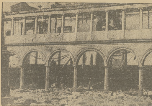
GRUZY, ZŁEISZCZA, ZABICI I RANNI oto skutki rewolucyjnych działań w północnej Hiszpanii, gdzie w Asturji było obok Barcelony główne ośrodko buntu elektorów lewicowych. Uniwersytet w Ojuno po zbombardowaniu przez buntowników.