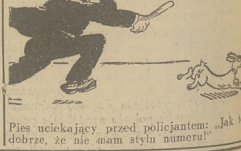
Pies uciekający przed policjantem: „Jak to dobrze, że nie mam styli numer!”