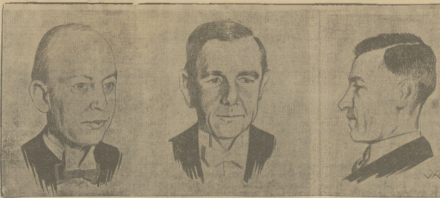
FITZMAURICE STARTUJE DO AUSTRALJI wyodowany z wysp Anglia — Australja, ustanowiony przez Scotta i Blacka.