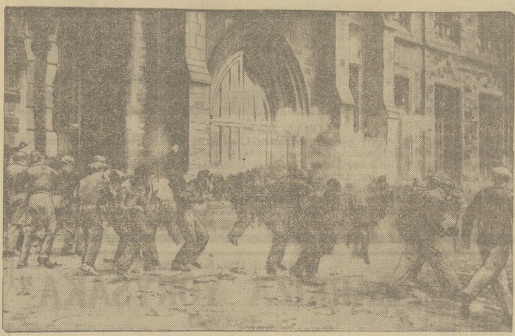
„WALKA WYBORCZA” W ANGLII.

ktoś się w nim namietnie zakochaly Wallack, zawierająca 12.000 listów miłosnych, polecił jego obrońca na stole sędzijsko. Listy te napisało 430 kobiet, które wszystkie chciały wyjść za agenta assekuracyjnego. On jednak zachował rozsądek, wzbranieżliwość i ograniczył się do poślubięcia „tylko” 28 z nich. Teraz zamknięty jest za donżuanem na pięć lat bramy więzienia.