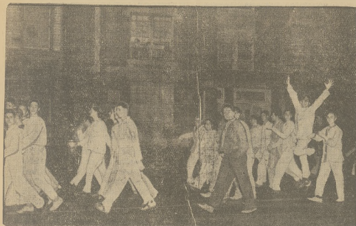
TRADYCYJNY POCOD STUDENTÓW NOWOPOLSKICH W PYJMACIACH. Jak co raz, odbył się i tym razem na inaugurację roku szkolnego uniwersyteitu w Nowym Jorku tradycyjny pocód studentów w pyjmaciach. Fragment tej komedii z tradycji przedstawia nasze zdjęcie.