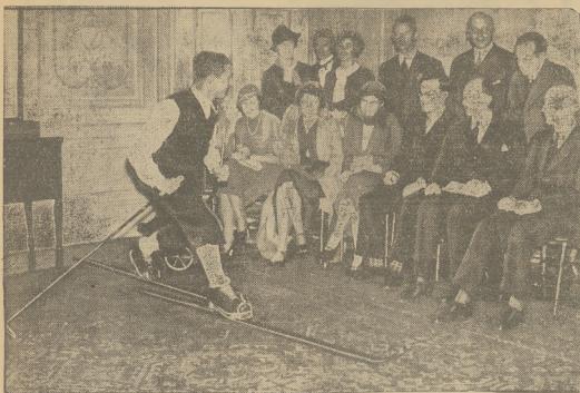
NAJPIERW NA DYWANIE... Teoretyczny wykład jazdy na łańcuch w Londyjskim Westend-Club. Instruktor demonstruje jazdę na... dywanie.