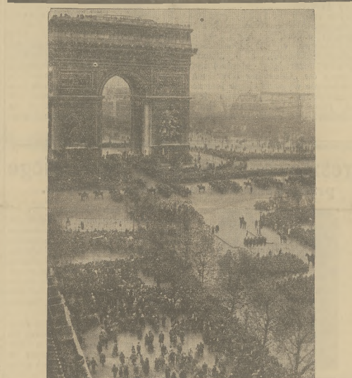
Obchód 16-jej rocznicy zawieszenia broni w Paryżu, na placu l'Étoile. Przed Łukiem Tryumfalnym odbyła się dołada wojska.

Antytek podobnej treści zamieścił również „Narodni Listy”.