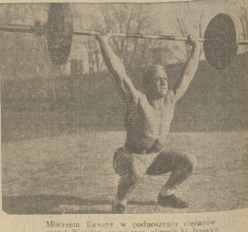
Mistrzyni Europy w podnoszeniu ciężarów...

Synowicy przez pp. Doktorów „BALSAM TRICOLORAN AGES” przy gryzicy, brzo-