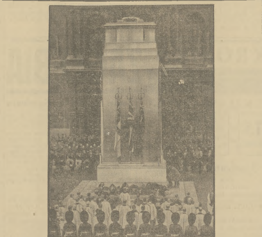
OBCHÓD 11 LISTOPADA W ANGLII.

W rzeczywistości jest jeszcze gorzej. Nie tylko, że się Wielkopolan nie powołuje do rządu, ale jeszcze się ludzi z innych dzielnic - oprowadza do Wielkopolski, np. do samodzielnicy. Czy się dziwić, że nasze zachodnie dzielnice czują się w tych warunkach skrzywdzone?