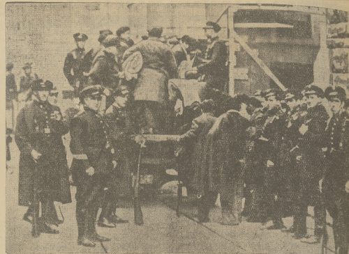
W powojnię hospodarskiej artysty dokonano tymi aranżowanymi, że w wozach zebrałki...

PROGRAM RADJOWY KONCERT SYMFONICZNY. Koncertem symfonicznym, jaki transmitowa-