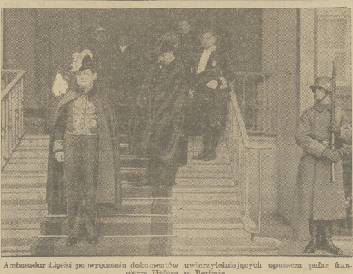
Ambasador Lipski po wręczeniu dokumentów uwieczniających ogłoszono pałac Kanclerza Hallera w Berlinie.

nastąpić rewizja granic, a potem powrócić króla do Budapesztu, imi zaś są wręcz przeciwnego zdania, najpierw restauracja, potem rewizja. Rozumnie się, że świat wie dobrze, że Habsburgowie nie zezwają nigdy z swej misji dziejowej skapania pod swej berłem nadanną krajów, wstąpił wielki upór Jugosławji i Czechosłowacji. Legitymizacji liczą się, że zbliżenie francusko-włoskie, zainicjowane jeszcze przez tragicznie zmarłego ministra Balmou, jedynie wreszcie do skutku, a wówczas Jugosławia stanie na wysokości dla Francji, jako jej sprzymierzonej i sama nie zdoła przezwyciężyć swych antyhabsburskich objętości. Paryż otrzymał bowiem podnie wiadomości z Berlina, że po Zagłębju Saary przy