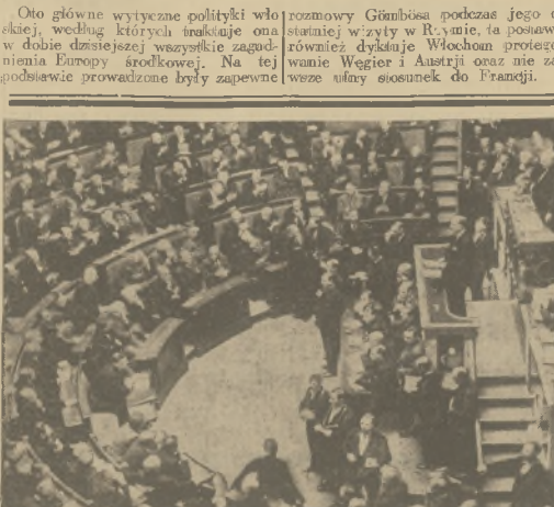
Gabinet Plandua przed parlamentem. Z trybuny przemawia premier gabinetu francuski.