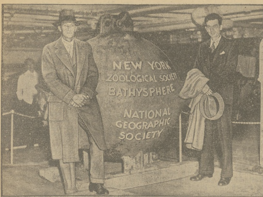
Amerykański budoż głębni morskich dr. William Beebe (z lewej) wraz z swym asystentem opuszcili się w stalowej kuli na głębokość 900 metrów, obserwując przez grubo szczeni życie na dnie głębokości.