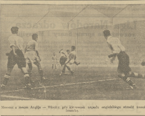
Moment z meczu Anglia — Włochy, gdy lewoskrzydłowy napastnik angielski strzelił sroczą bramkę.

Słuszenie, czy nieśluszenie, czy też może bardziej przebiegowe walki w dn. 14 km. odpowiadający wynik i emisjowy (te głosy czytamy teraz na szpalkach prasy sportowej, omawiającej się mecz obszer- nie) — faki pozostanie faktem. Anglięz ponownie zdominowali, że są najlepszymi piłkarzami świata. Kiedy po- trzebna kiedy walka która o powołaniu stawkę kiedy idzie o prestige futbolu angielskiego, cięższego jest 70.000m. Anglię — potrafi dobrze zgrać i wygrać. Z każdym przeciwnikiem, który ma pretensje do tytułu piłkarskiego mistrza świata.