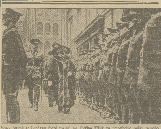
Nowy burmistrz Londynu (berd major) sir Stolfen Kilkil na przeglądzie pułku szańcowanego w Londynie.

mierze od szeregu warunków. W dziedzinie wojny są one przeważnie groźne i wobec coraz to nowych danych, ilustrujących rzeczywisty stan zbrojeń niemieckich, są szczególnie poważnym ostrzeżeniem.