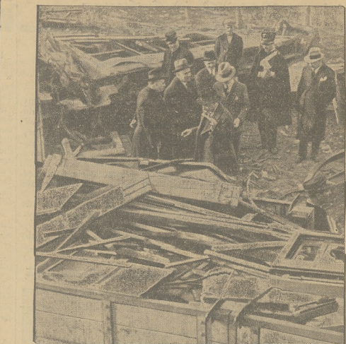
Na scenie kolejowej, wcielonej na Wesołujuzie miała miejsce katastrofa. 7 osób zostało zabitych a 9 ciężko rannych.