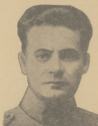
NAPOLEON POLUNINOWSKI AMERYKAŃSKI. Taką tylko nadano dowódcy szóstaj ankiety państwowej, generalowi Bogdanowi, który odniósł zwycięstwo nad przeważającą siłą Kami Bolniewi.

Żybi wiele względów zasadniczych przemawia za tem, aby te pilną reformę zarówno w odniesieniu do wojska jak i urzędów państwowych — szybko przeprowadzić.