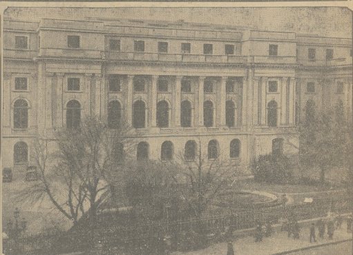
NOWA REZIDENCJA KRÓLA RUMUNJI Kilka dni temu król Karol rumanicki objął w Bukaresztu, wzniesiony za pieniądze starego, który spłonął w 1927, Odląd nowy zamek na Cașea rezidențială króla.