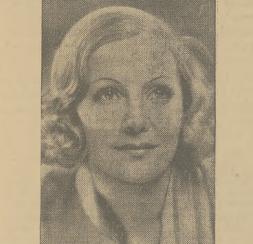
GRETTA GARBO PORZUCA FILM!

Znakomita artystka filmowa, Gretta Garbo, kupiła olbrzymią gamtę komercyjową w Szwecji, holmie i chce zwrócić się na teatr, gdzie po powrocie z Ameryki kierowała oddziałem w teatrach Sztokholmu. Na przeszkodzie jej w tym: Gretta Garbo, z prawej: front gmachu desyatnego, który nazwany będzie jej imieniem.