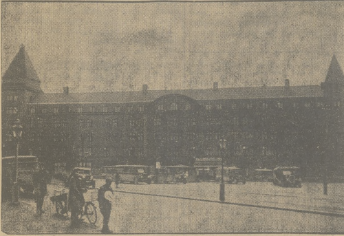
Widok na miasto i port w Wenecji, gdzie odbył się kongres Eucharystyczny.

Redaktor naczelny od godz. 11 - 1 do 6 - 7 Rękopiśm. redakcja nie zwraca.