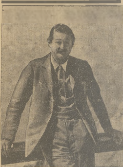
ZMIANY W POLICJI SAARSKIEJ.