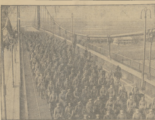
Na Sarwie pod Belgradem, stolicy Jugosławji, odbyło się uroczyste otwarcie o brzymiego mostu, wykonanego przez techników francuskich kosztem 400 milionów ólarów.