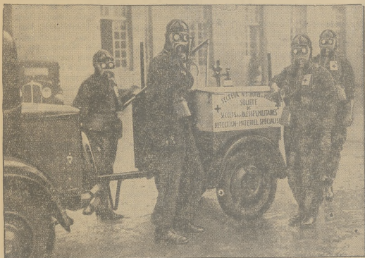
Aktej w kierunku obrony przeciwgazowej i lotniczej przewożoną jest we Francji skute i intensywnie.

Redaktor naczelny przyjmuje od godz. 11 — 1 i od 6 — 7 Rękopisów redakcja nie zwraca.