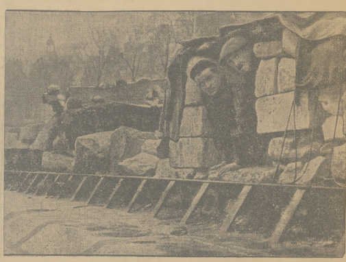
Kleka bezrobocia we Francji przybliża coraz szersze rozmiary. Łączy się z nią kwesta bezdomności. Ilustracja przedstawia junkistów paryzkich, bijących nad brzozi-gami Sektwora.

Samolot francuski, lecący w kierunku lotniska Croydon, wstrząsłkł gościej smędy upadł, ledwając na dom w podmiejskiej okolicy Londynu