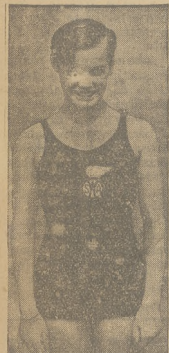
PLYWACZKA POTRAWIANA AMATORSTWA.