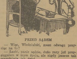
— Więc, wieśniaki, masz odwagę przysięgać mi w tym życiu, ale nigdy jeszcze tak prawdziwie jak dziś!

Teatr miejski z Sosnowca wystawia w dniu 14 bm. w sali kina „Orzeł” w Olkuszu znakomitą sztukę p.t. „Wiosenne porządki”.