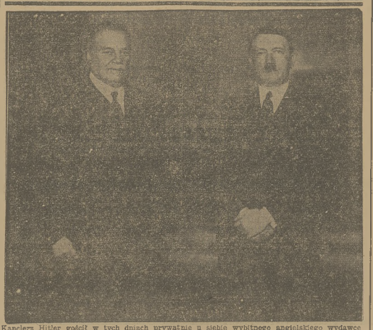
Kanceler Hitler gościł w tych dniach prywatnie u siebie wybitnego angielskiego wydawcę dzienników Viscounta Rothemera. Widzimy ich obu na zdjęciu.

ni międzynarodowej zgłogozory zostaną los naszych braci, którzy bytują w państwie — naślądającym niewolniczo wzory prasliki „bakaty”.