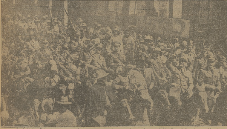
szarym wleci Mas Haniu (na pierwszym planie w pustynie) udaje się w towarzyszenie wiekroli Abymy Głazianego (drugi z prawej) na uroczystości wzięcia mu medalu za waleczność.

Olbrzymie postępy W MOTORYZACJI NIEMIEC Ogłoszone zostały oficjalne dane sta- tystyczne, dotyczące motoryzacji Rze- szy. W grudniu r. 1956 zarejestrowano 29 714 nowych samochodów. Ogółem w ciągu całego ubiegłego roku zareje- strowano w Niemczech 456 818 nowych wzłów, co stanowi przyrost rekordowy W stosunku do r. 1955 wzrost liczby zarejestrowanych samochodów jest stykrotnie większy, dwa razy większy niż w r. 1954 i o jedną czwartą więk- szy niż w r. 1955. Z ogólnej liczby pojazdów mehani- cznych zarejestrowanych w r. 1956 — przypada 215 590 na samochody osobo- we, 56 942 na ciężarowe, 2 117 na auto busey, 8 881 ciągniki i wreszcie 175 596 na motocykle.