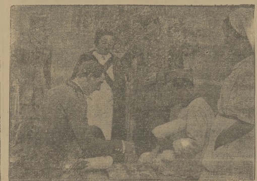
Żołnierze hiszpańskiej armii powstańczej w szpitalu.

„Rzesz Kaszubska” pismo separatystyczne i wrogle polskości wznowilo swą działalność na Kaszubach. Pismo napada na osiedźników górali na wsiach, podjudzając przeciwko nim żywiele nasrojonych Kaszubów, pozostym w dalszym ciągu mający na temat organizacji „Państwa kaszubskiego” itp. bzdu. Pismo jest bojkotowane przez czujących szczerze po polsku Kaszubów.