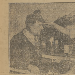
Dwaj fabrykanci szkła, wyprodukowawary nie- tuchące się batalii, wypuścili za reklamę takie oto wymowne zdjęcie.