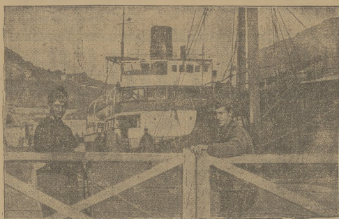
Hiszpańska flota powalająca zarzewiowad i odprowadzająca do portu w Bilbao sownicki statek transportowy. Na strzyż stoi dwóch młodych falangistów.