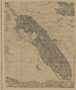
Baglięsto statek „Wierge Marie” rozbił się w czasie burzy o skały u południowo-wschodnich wybrzeży W. Brytanii.

TRAGICZNY WYBUCH KOŁA Wczoraj rano około godz. 8:40 władze policyjne i straż pożarna, zostały zaalarmowane o wybuchu koła w fabrycznym składzie papierowych p.t. „Laskowski i Ska, w Łodzi. Wybuch koła spowodował uszkodzenie składni szczytowej fabryki. Znajdujący się w składni i w pobliżu robotnicy domarli cięższych i lżejszych obrażeń, przy czym zostało rannych 7 osób. W kilkanaście minut po wybuchu nastąpiło zawalenie się uszkodzonej składni, której gruzy poraniły dal sze trzy osoby. Na miejscu wypadku przybyły władze bezpieczeństwa, straż pożarna i pogotowie ratunkowe. Akcja ratownicza trwa w dalszym ciągu. Straż pożarna zabezpieczyła nury przed dalszym zawaleniem się.