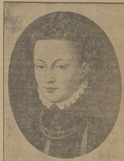
850-LECIE ZGONU MARII STUART W dniu 8 km maja 350 lat od śmierci Marii Stuart, królowej szkockiej, straconej przez cesarza miejsc w literaturze i sztuce w wielu miejscach i pisarzy.

za specjalne usługi położone w dziedzinie polityki zagranicznej. Jak słychać komisarz Litwinow miał w podróży z Genewy do Moskwy odbyć rozmowę ze Stalinem, podczas której wskazał się na ataki skierowane przeciwko niemu i jego żonie W związku z tą rozmową mówi się w Moskwie, że Litwinow ma objąć jedno z placówek dyplomatycznych, przy czym wyznaczono sz. stanowiska ambasadora ZSRR w Paryżu, Londynie, alho Rzymie. Mówi się przy tym, że najprawdopodobniej Litwinow obejmie stanowisko ambasadora w Londynie.