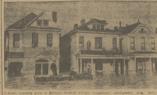
Podczas wstawy pów w Berlinie otrzymał uwagę wyjątkowo inteligentny pies, który uwiłnił przysiężonego do kresła.

Młodzież z domu zamiast do szkoły, udawała się do klubu. W zakonspirowanym pokoju pito wódkę, grano w bilard i karty. Stwierdzono, że wielu ucni przegrywało tam wszystkie swoje pieniądze.