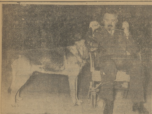
Podczas wystawy pów w Berlinie zwracał uwagę wyjątkowo inteligentny pies, który u- wolnił przywołanego do kresla.