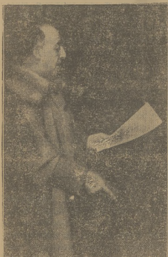
Przywódcą ruchu powstańczego w Hiszpanii gen. Franco przemawia przez radio po zajęciu Malagi.

Wypadek ten wywołał silne poruszenie w Poznaniu.