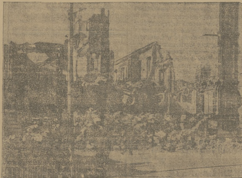
Tak wygląda Malaga po zbombardowaniu jej przez artylerię powstańczą.

dziali republikańskie zajęły czterema ofortyfikowane pozycje powstańcze obszarne przez wojska niemieckie. Zdobyły większą ilość amunicji i materiału wojennego.