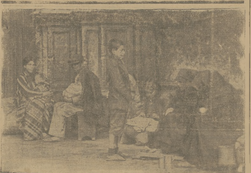
TRAGICZNE SCENY W ULIC MALAGA

Aresztowanego Chwałka oddawiono do dyspozycji prokuratora sądu okr. w Cieszyńcu.