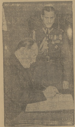
Podczas pobytu w Warszawie premier polski gen. Gombisz złożył wizytę P. Prezydentowi K. P. Marszałkowi dwigniemu-Rydzowi oraz premierowi gen. Sławoj-Skłodkowskiemu. Na ilustracji premier Gombisz wpisuje się do księgi audiencyjnej na Zamku warszawskim.