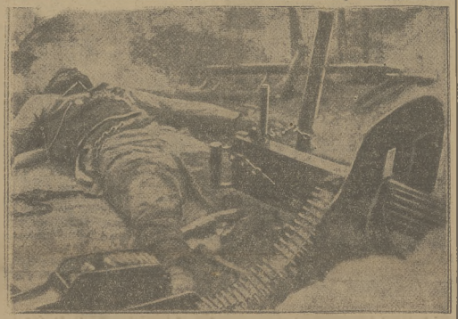
„OCHOTNICZY” CZERWONEJ ARMII W HISZPANI Wobec tego, że coraz mniej jest amatorów wojny po stronie „czerwonych”, władza bolszewicka „ochotników” przysłała łachudkami do karabinów maszynowych — jak to widać na ilustracji — by od nich nie uciekali w czasie walki.