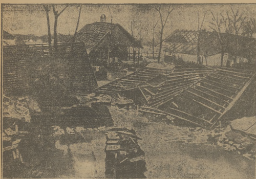
POWODŃ NA WĘGRZECH

Powódź nawiedziła nie tylko Amerykę, lecz również niektóre państwa Europy, m. in. Francję i Węgry. Oto skutki powodzi na Węgrzech.