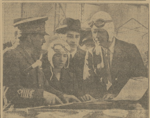
MAŁEŃSTWO LINDBERGOWIE W TRYPOLISIE. Odbywający podróż samolotem państwo Lindbergowie przybyli do Trypolis, gdzie przebywał ich mąż, Balbo, gubernator Libii.