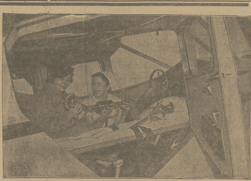
NOWY POMYSŁ. AMERYKAŃSKI Auto do przewożenia chorych i potrzebnych przyrządków chirurgicznym.

× WYZYTACJA SZKOŁ. W ciągu ub. tygodnia władze kuratorskie wyzotywały gimnazjum żeńskie im. H. Maltowski i gimnazjum męskie w związku k z otwarciem kółec w przyszłym roku szkolnym.