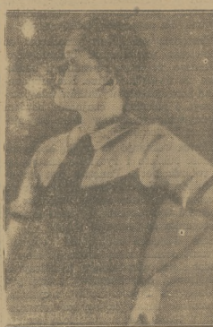
Fotografia może być używana w murze i używana w sportach.

Tak, Ben Kition, ty stanieś sobie tutaj. A oto, panie Hearson, pańskie miejsce. Tylko, moi panowie, bez łoku, na każdego przyjdzie kolej. A teraz pan Rayne i jego świta. Tu o króko stanie panna Wingrove, a nadopieć niej Evans. Panie putkownika, dla pana zarezerwowane pozycje konia. Kochany kolego Elliot, nie, nie wymi-