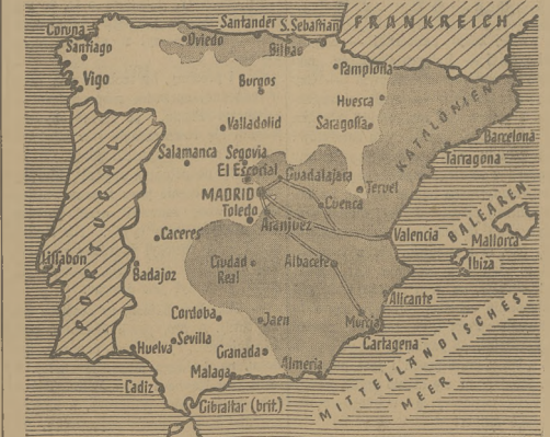
Sytuacja na froncie hiszpańskim - kółka w łagodnie. Wykropkowany teren zajmują wojska rządowe.

Gmach ambasady sowieckiej w Madrycie został podpalony przez niewiadowych sprawców. Straty wywołane przez pożar są bardzo znaczne.