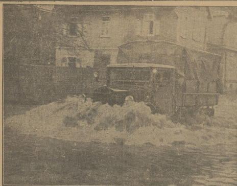
POWÓD W NIEMCZECH

Wakulec wielkich opadów śnieżnych cały szereg miejsc nad Memem nawiedziła powódź. Ulce miast zostały zalane wodą, tak że komunikacja stała się wielce utrudnioną.