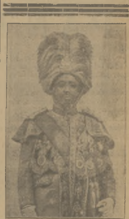
RAS DESTA ROZSTRZELANY

Jak doniosły urzędowe komunikaty włoskie, ostatni wódz armii abrydzkiej ras Desta został schwytany i natychmiast rozstrzelany. Zwińki jego mają być asprawnowane do Addis Ababy i dla ostreżenia ludności wystawione na widok publiczny.