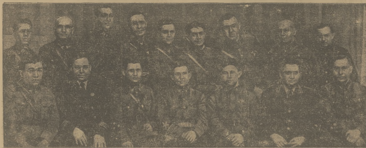
GPU — DOMENA ŻYDÓW