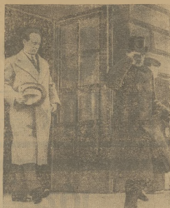
Król belgijski Leopold bawił w Sotokholmie. Na obiedzie król Leopold wychodzi z dworca w towarzyszywie księcia Karola sasko-weimarskiego

widok, bo głowę ma tak zmasakrowaną, że przedstawia ona jedną, wielką ranę. O stanie trupa świadczy fakt, że tyśo wiry były zamordowanego nie można absolutnie rozoznać. Nig ulegała niemożliwej wagi, że niemiecki ślady został w chydny zamordowany. Zbrodniarz sadyśia musiał się nęcać nad swą ofiarą, na o wskazują liczne ślady uderzeń, jakim tempem narzę-dziem, siarę ślady na soku dowodzą, że zbrodniarz dusił swą ofiarę. No ścież-ke odnalazłom liczne ślady stóp, co do-wodzi, że między mordera, z ofiarą rozogadła się rozpaczliwa walka. Po-boderstwie zbrodniarz obciągnął ukryte ślady, niezgodną trupa do kzewów. Przy zamordowaniu nie znalazłom za-danych dokumentów, któreby pozwoliły na ustalenie tożsamości.