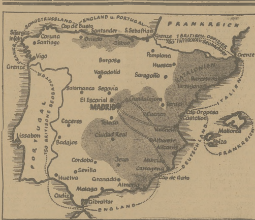
Na skutek porozumienia oświadczonego w Londynie kontrola międzynarodowej granicy hiszpańskiej kontrolowana będą przez szereg państw. Mapa określa strefy objęte przez poszczególne państwa.

Wymiana oparta w tej dziedzinie na zasadzie wzajemności przyniosła by dużą ulgę krajom pozbawionym własnych zasobów surowcowych, ubogim w kapitały i umożliwia by im przeznaczenie większych sum na bezpośrednie renowacje inwestycje przemysłowe.