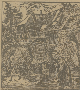
Wspaniały drzeworyt przedstawiający życie wsi.

Elektrownia Okręgowa w Zagłębiu Dąbrowskim, S. A.