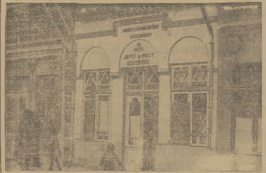
W Rumini dostało do okesów antyżydowskich, które przetrwały się w napisy na murach kania żydów. Na zdjeciu z demowalnoy dom modlitwy.

TRIO HELSCY — znane narodowe i akrobaticzne LUDZIA GAWICZ — tańca wiodelska w swoim repertuarze W niedziele i święta od 17 do 19 godz. Five o'clock z pełnym programem.