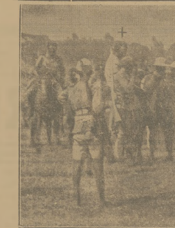
WÓDZ ABISYŃSKI - PRZED ROZSTRZELANIEM Jak donosiłszy, ostatni paryżanin Abizyżi przed rozstrzelaniem przez kowój przed sądy, który wydał wyrok śmierci przez rozstrzelanie.

Berlin, w marcu. Doroczną wystawą samochodową w Berlinie jest jakoby egzaminem z postępów zbrojonych przez Niemcy na polu motoryzacji przez rok ubiegły.