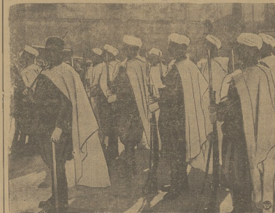
Z FRONTU HISPZAŃSKIEGO Reprodukcji zdjęć przedstawiające oddziały marokkańskie, walczących na terenie hiszpańskiej wojny domowej w oryginalnych strojach.