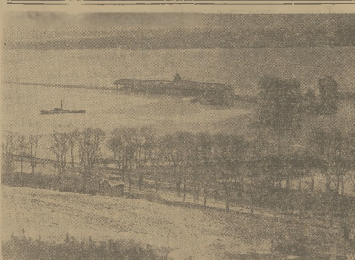
GROŹNA POWÓDŃ NA POMORZU W związku z ostatnim groźnym wypływem Wisły na Pomorze, reprodukcję zdjęcie, przedstawiają fragment zniszczonego spławożwanego powodnia w Legnowie, gdzie wzniesiona wałda zniszczyła całkowicie barielaję, tor wiela ród razem z trybunami, podnięła asose na trasie Toruń — Bydgoszcz i począłna duzo spulsenienia w polu i ogrodach. Na zdjęciu koło Wisły znajduje się w oddali za malymi punktami, oszarniętymi drzewa. Na pierwszym planie tereny nawadniona porożnity.

woła o jakiegokolwiek intrzy, czy osobistych ambicji. Przypominać, każdy, kto namie poglądy podziela, kto z nami pracować pragnie, nasz reprezentant narodu jest nam przyciociem zupełnie niezależnie od tego, w jakich szeregach dotychczas przebywał.