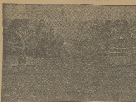
OBRAZKI Z WOJNY DOMOWEJ W HISZPANII