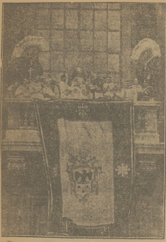
Przejęt. Ks. XI i balokom koscioła św. Piotra w Rzeszynie udzielił rezery wianami błogosławieństwa apostołskiego.