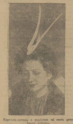
Kapeluszczyca z rodzicami od emcia przybrany ojczym.

WALNE ZEBRANIE KUPCÓW. W dn. 11 m. o godz. 10 w lokalu własnym przy ul. 3 Maja 11, odbędzie się walne zebranie kupców polskich pow. Olkuskiego z udziałem przedstawicieli władz państwowych i samorządowych. Zebranie poprzedzi nabożeństwo o godz. 3 rano.