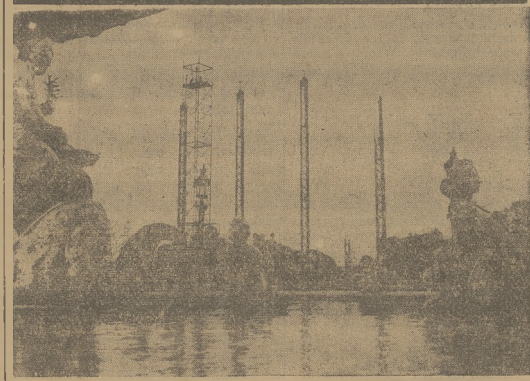
PRZED OTWARCIEM WYSTAWY W ŚWIATOWEJ W PARYŻU Już tylko trzy tygodnie dzieli nas od terminu otwarcia Wystawy Światowej w Paryżu, na którą została zaplanowana najnowocześniejsza i zdobycz świata w dziedzinie techniki i najwspanialsze okazy sztuki. Na Wystawie będzie, jak wiadomo, reprezentowana Polska, która przez własnego reprezentacyjnego pawilon uzyskała również szereg stoisk w pawilonach ogólnych i przemysłowych. Zdjęcie przedstawia fragment końcowych prac przy monumentalnej bramie na terenie Wystawy od pl. Zgody.

LONDYN, 10.4 (tel. wł.). Cztery parowce angielskie, udające się do Bilbao z żywnością, zostały przez powstańców wezwane do zawrócenia, gdyż w przeciwnym razie będą zatrzymane przez statki powstańcze. Wobec tego, że Bilbao jest przez powstańców blokowane, okręty brytyjskie zawinę do portu francuskiego St. Jean de Luz, z wracając się równocześnie do władz brytyjskich z prośbą o ochronę. Rząd brytyjski nie zajął w tej sprawie jeszcze swego stanowiska. Brytyjskie sfery miarodajne wskazują, że sprawa ta będzie rozwiązana przez odpowiednie czynniki rządu brytyjskiego, po czym zgodnie odpowiednia decyzja. Określenie polaco-nia na razie pozostać w St. Jean de Luz. Kapitan parowca „Hamsterley”, jedynego z omych 4 okrętów, zawiadomił dziś władze brytyjskie, że generał Franco zapowiedział, iż w żadnym wypadku nie dopuści okrętów do Bilbao, nawet wtedy, gdyby się miał narwać na konflikt z brytyjską marynarką wojenną.