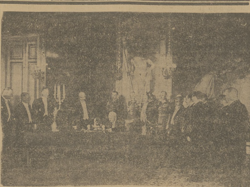
DRUGA ROCZNICA KONSTYTUCJI KWIEŃNIOWEJ

Podkreślam wczoraj, że w najbliższym czasie jedną z dalszych konferencji poświęconej specjalnie sprawie „Kosa” dowojscij i będe mógł wyjasnić, w jaki sposób „pragnięmy rozstrzygnąć tę sprawę”.