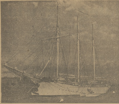
STATK SZKOLNY „ISKRA” W PODRÓŻY DWUCIECIEJ PO MORZACH W czwartek opłynęł Gdynię flagowy statek szkolny marynarki wojennej „Iskra”, udając się z 21 podchorążymi marynarki wojennej w 6-miesięczną podróż dwucieczką po morzach całego kontynentu.