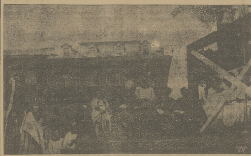
JUBILEUSZ KSIĘCIA METROPOLITY KRAKOWSKIEGO

W ub. niedzielę, jak już donosiliśmy, odbył się w Krakowie uroczystość wiązana z uroczonym 25-letnim jubileuszem rządów archidiecezji krakowskiej przez J. E. księcia archidiecezji, ks. Adama Sapiechę, metropolicę krakowskiego. Zarząd m. Krakowa, pragnąc oddać hołd szesnastu Księcia-Jubilate, nadał Mu na uroczystym posiedzeniu obywatelstwo honorowe Krakowa, oraz z uwagi na bardzo pozytywne charakterystyki działalności ks. metropolity, nadał mu około 100.000 złotych miastowych Krakowa. Uroczystość obchodu jubileuszowego odbył się na Ryńku krakowskim, gdzie po mszy św. pontyfikalnie, celebrowanej przez ks. Jubilate, została zorganizowana akademja, podczas której społeczeństwo wrocławskiego grudu oddało hołd ówczesnej pracy ks. metropolity krakowskiego. Zdjęcia naszego przedstawiciela ks. habilita w obecnym duchowieństwie, oraz przedstawicieli władz państwowych i wojskowych, na specjalnej podaż, podczas akademji.