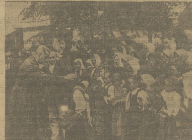
WOJEWODA KRAKOWSKI WÓDŁO LUDNOŚCI SPISKIEJ W ostatnich dniach wojewoda krakowski p. Michał Głodnicki, przybył na polski Spisz, wstąpił bardzo serdecznie przed ludność. P. wojewoda, poza urzędowymi inspekcjami, wykonywał organizację społeczne na Spiszu i nawiązał serdeczny kontakt z społeczeństwem. Zdjęcie nasze przedstawia moment powitania p. wojewody Głodnickiego przez dzieci szkolne w Frydmanie na Spiszu.

Plany te ujawnione zostały Tuchaczewskiemu przez sztab czechosłowacki podczas jego oficjalnej wizyty w Pradze, po zawarciu paktu czechosłowacko-sowieckiego.