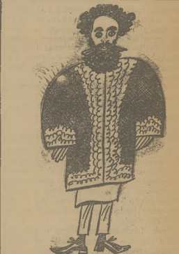
B. CESARZ ABISYŃSKI

Wzięmy dla przykładu linię Warszawską — pizze dziwnie. Wagonów nie remontuje się prawie wcale. Na linii kursują wozy bez oświetlenia, z przeszkolonymi drzwiami w wagonach nieopisanie brudny. Zderzył się nawet wypadek, że do pociągu przypięzono świeżo pomalowany wagon (N. 5179). Wszyscy pasażerowie na sobie doświadczali skutków tego bezczelnego niedbalstwa administracji kolejowej.