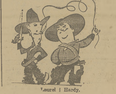
Laurel i Hardy.

Kluby np. przypuszczają, iż może istnieć klub, który nosi nazwę „Stowarzyszenie osób mających się wystrzeżać zwyczajowi zwracania się do kon-