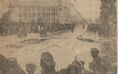
Z igrzysk sportowych o mistrzostwo M. O.