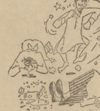
Chorem przeprowadzono transję krewi Zabieg udeł się nadeptadzie...