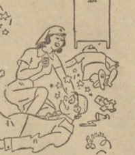
Chorem przeprowadzono transję krewi Zabieg udeł się nadeptadzie...