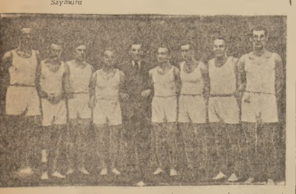
Najlepsi walczące KKS „Olszy”, drużyna, która jest prawie w całościem mistrzem Krakowa, po pokonaniu najgroźniejszych rywali, Wilki, AZS i Cracovi.