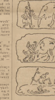
Jak powstały narty...

I obrali się choć zdżądni! Dr ST. MIELECH