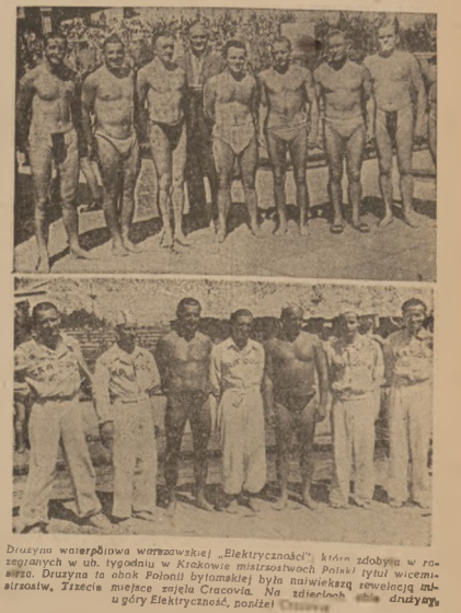
Drużyna watterpolowa w Warszawie... Drużyna watterpolowa w Warszawie...