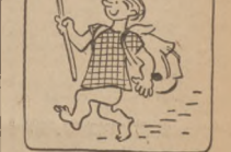
Do przodu... Do przodu... I duch tęga polskiego znanom...