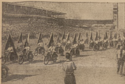
Delikatna muzyka... Delikatna muzyka... Festiwalu młodzieży w Pradze...