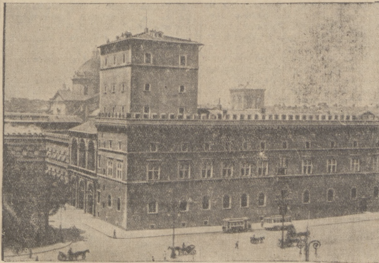
Pałac wenecki, w Rzymie, gdzie odbywają się ważne rozmowy Mussoliniego z Lavallem.

RZYM, 6.1. (PAT.) Dziś przedpołudniem odbyła się druga dłuższa konferencja Lavalala z Mussolinim w pałacu weneckim.