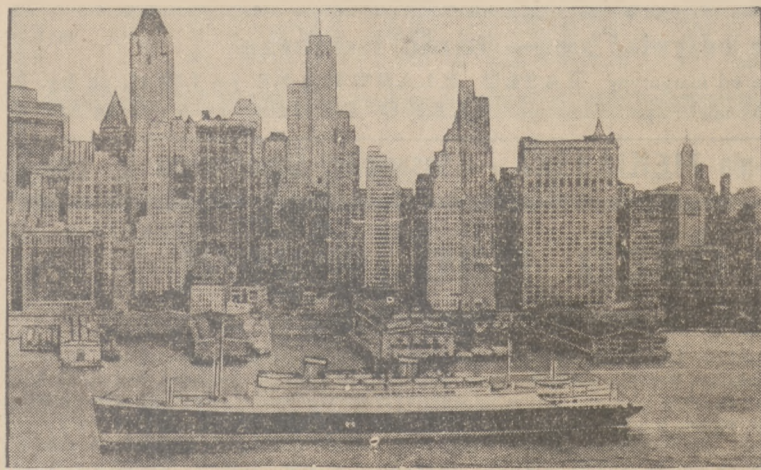
W samym centrum New Yorku, na r. zw. East River w pobliżu mostu, łączącego Manhattan z Brooklynem, nastąpiło straszne zderzenie dwóch statków, przyczem statek handlowy najpóźniej ma okręt pasażerski „Lexington”. Spośród 200 pasażerów, zgromadzonych na pokładzie statku, 15 osób postąpiło życie. Przerazeni pasażerowie skalkali do łodowatej wody, lecz parowcom i tożelhom ratunkowym udało się ich wyratować. Na zółjęciu East River z dymocząmi chmur Manhattan, centrum New Yorku, w głębi.

NOWY REKORD CARACCIOLI. Znany automobilista włoski Caracciola podczas zawodów na autostradzie berlińskiej Avus zdobył nowy rekord osiągając szybkość 311.96 km./godz.