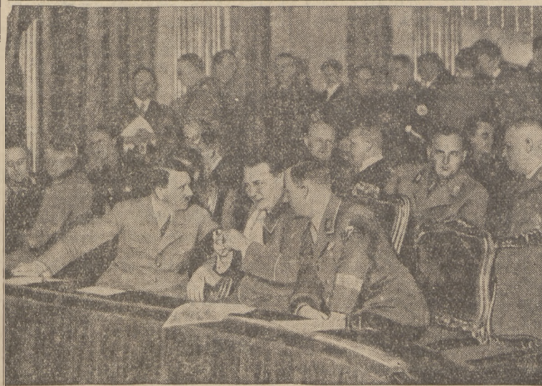
MANIFESTACJA WIERNOSCI DLA KANCLERZA HITLERA.

mi mogłyby wyrzucić niekorzystny wpływ na decyzję saarskich wyborców. Hitler jednakowoż nadal swemu przemówieniu charakter wewnętrzno-polityczny i przemawiał przeciwko żywiłom, które przez całe 14 lat przesładowały ruch hakenkreuzlerowski, a więc przede wszystkim przeciw samym Niemcom i unikał polemiki z innymi państwami, starając się pozostawić sobie otwartą drogę do przyszłych rokowań z Zachodem.