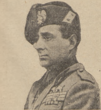
Przewodniczący włoskiego komitetu olimpijskiego, Achille Starace, zarazem generalny sekretarz partji faszystowskiej, uległ niechcący wypadkowi. Zjeżdżając na marciach ze stromej pochylności upadł tak fatalnie, że doznał złamania kołnierza.

Jak widać z tego — po przejściu na emeryturę gen. Osińskiego, gen. Sikorski miałby wśród generałów trzecie miejsce co do starszeństwa.