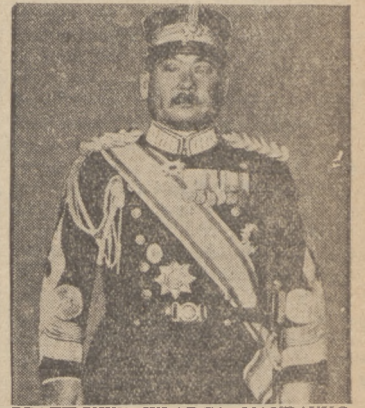
PRAWDZIWI WŁADCA MANDZUKO, Generalissimo japoński Jiro Mianam, poseł na dworzec cesarza Puji i dowódca japońskiej armji w Mandzuku.

Moskiewska „Prawda“ komentując wyrok wojennego kolegium sądu najwyższego, mocą którego Nikołajew i dalszych 13 oskarżonych zostaje skazanych na śmierć, pisze w artykule zatytułowanym „Jeżeli nieprzyjacieli się nie poddaje, musi być zniszczony“. Wyrok ten sygnalizuje wszystkim pracującym państwa sowieckiego, że należy jaknajbardziej rozszerzyć rewolucyjną czujność wobec jawnych i tajnych wrogów socjalizmu, nakazuje spotęgować osiorność wobec wszelkich prób podważenia gospodarczej i politycznej siły partji. Wrogi klasowy — pisze „Prawda“ — musi być wszędzie — w kolchozach, fabrykach, w sowietach i organizacjach partji — stanowczo odpartym siłami, niemilosierdnym ciosem“.