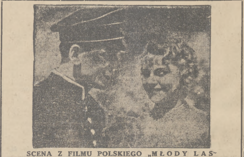
SCENA Z FILMU POLSKIEGO „MŁODY LAS”

× CHOROBY ZAKAŻNE. Urząd zdrowia w Zawierciu, zanotował w ub. tygodniu następujące wypadki chorób zakaźnych: gruźlica 2 (zgon), róża 2, błonica 2, krztusiec 1. W ciągu całego ub. r. na terenie Zawiercia zanotowano 91 zgonów i zachorowań 277.