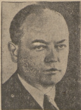
REPRESJE PRZECIWKO NIEMCOM KŁAJPEDZKIM.

Nie brak tym młodym pomysłów: „Neomperializm”, — „neomilitaryzm”, — „neonacjonalizm”... Puste frazesy, sieczka ideowa.